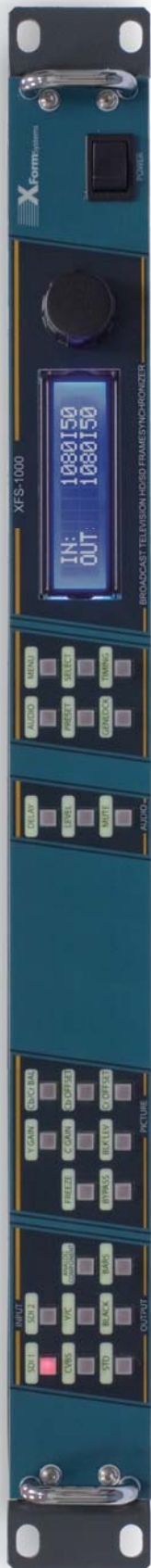
(基本配置不包含本地控制面板)